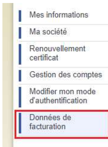
Figure 1 Sous menu "Données de facturation" depuis mon réseau