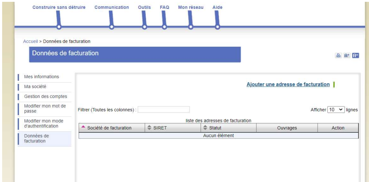
Figure 3 Page "Données de facturation"