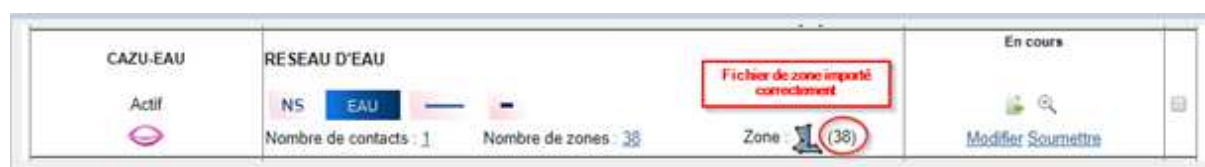
Figure 7 Fenêtre de confirmation import

Le nombre de zones impactées par votre fichier de zone sera affiché à droite de l'icône polygone, de la colonne dénomination, de votre liste des ouvrages.