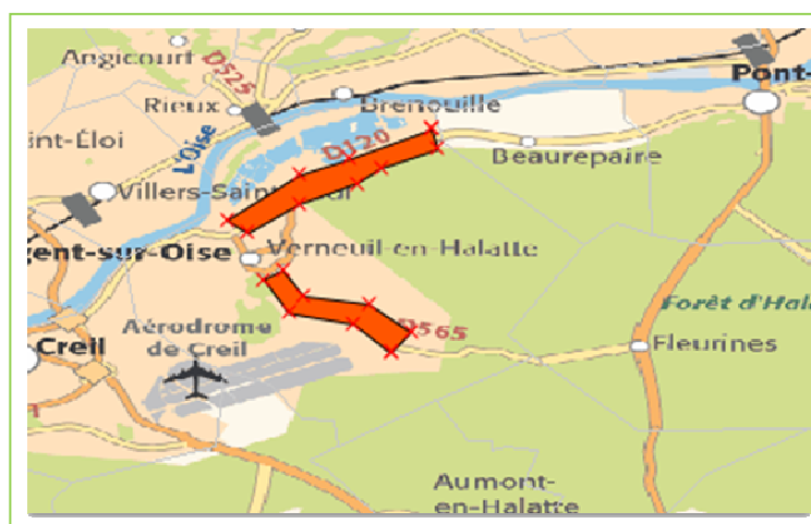
Figure 12 Objet multi-polygones

Vous pouvez importer un objet multi-polygones. Ces derniers doivent avoir des zones-codes différents.