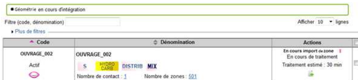
Figure 6 Temps de traitement Import zone

Une vérification est effectuée sur la conformité du contenu de votre fichier et sur la cohérence des informations transmises. Le fichier est accepté, votre ouvrage passe alors au statut En cours import zone . En dessous de ce statut, une estimation de délai d'attente avant traitement du fichier et du temps de traitement estimée pour ce dernier est affichée.