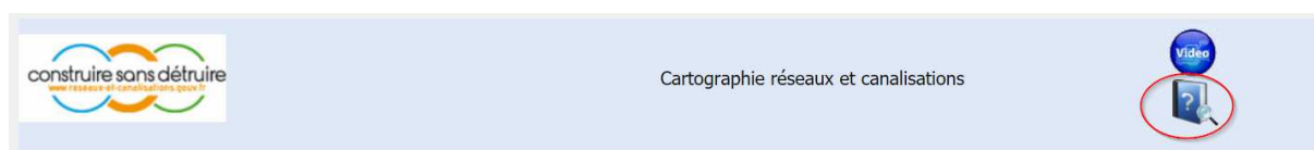
Figure 1 Lien vers la brochure explicative CARMEN

Pour éditer la zone d'implantation d'un réseau puis l'enregistrer sur le téléservice via le site web reseaux-et-canalizations.gouv.fr , vous pouvez utiliser ce lien http://carmen.developpement-durable.gouv.fr/199/reseaux-et-canalizations.map et suivre ce qui a été mentionné dans la notice d'emploi accessible par le point d'interrogation en haut du portail.