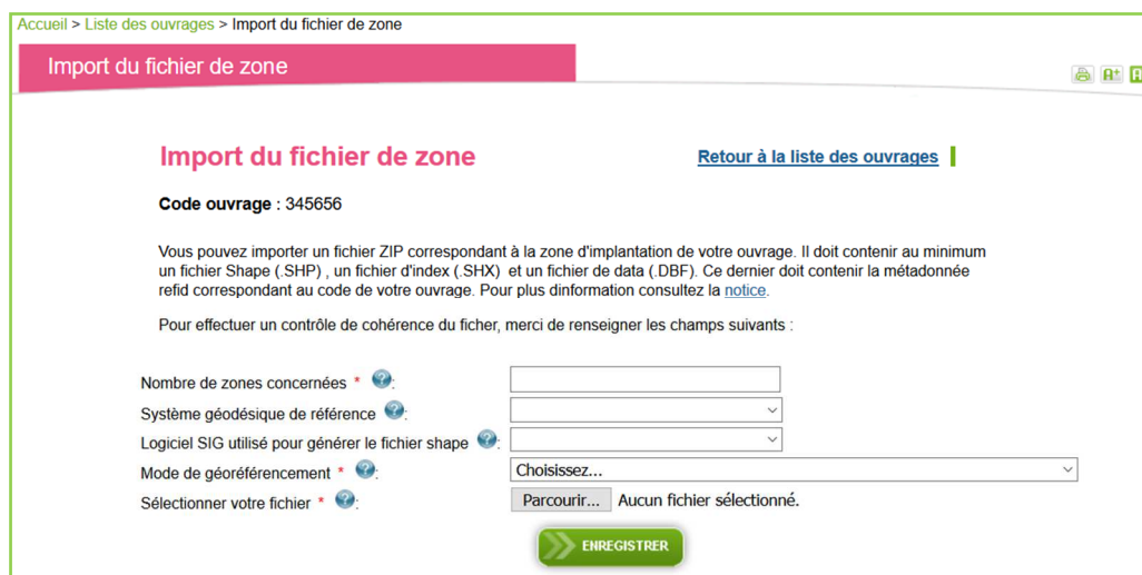
Figure 4 Page Import Zone

La page d'ajout de fichier de zone propose le renseignement des champs suivants :